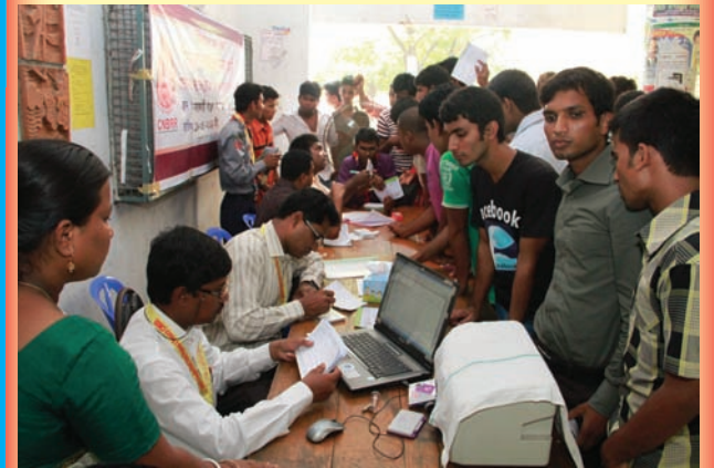
(সরকারি বাঙলা কলেজে সি.এন.বি.আর.আর এর আয়োজিত বিনামূল্যে রক্তের গ্রুপ নির্ণয় কর্মসূচি)

যে কোন পূর্ণবয়স্ক মহিলা বা পুরুষ সুস্থ শরীরে ৩ থেকে ৪ মাস পরপর রক্ত দিতে পারে। রক্তদাতার বয়স ৫৫ বছরের নিচে ওজন ৪৫ কেজি'র বেশী হতে হবে। ব্লাডপ্রেসার ১০০/৬০ মি.মি. এর বেশী ২০০/১০০ মি.মি. এর নিচে হতে হবে। নাড়ীর গতি মিনিটে ৬০ এবং ১০০ এর মধ্যে হতে হবে। রক্তস্বল্পতা থাকবেনা। নিশ্চিতভাবে জেনে নিন যে, রক্ত দান করলে শরীরের কোন অসুবিধা হয় না বরং কোন কোন ক্ষেত্রে উপকারিই হয়। তবে মনে রাখতে হবে, কোন অবস্থাতেই সংক্রামক রোগীর (যেমন-সিফিলিস, ভাইরাল হেপাটাইটিস, যক্ষ্মা, এইডসসহ বিভিন্ন সংক্রামক রোগ) রক্ত অন্যের শরীরে দেয়া যাবে না। রক্ত গ্রহণ করার পূর্বে অবশ্যই দাতার রক্ত পরীক্ষা করে নিতে হবে তা যত নিকট আত্মীয়েরই হোক না কেন।