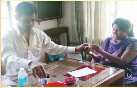
(সরকারী বাঙলা কলেজে সি এন বি আর আর এর আয়োজিত বিনামূল্যে রক্তের গ্রুপ নির্ণয় কর্মসূচি)