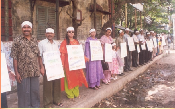
(রক্তদানে গণসচেতনতা বৃদ্ধির লক্ষ্যে সি এন বি আর আর আয়োজিত মানববন্ধন)

মানুষের প্রয়োজনে আপদকালীন সময়ে রক্ত সংগ্রহে সাহায্য করা ও সার্বিক চিকিৎসায় সহযোগিতা করা। সমাজে সকল শ্রেণীর মানুষকে রক্তের গ্রুপ জানতে ও রক্তদানে উৎসাহিত করা। বিভিন্ন সময়ে উৎসাহী মানুষের রক্তের গ্রুপ নির্ণয় করা। সমাজ সচেতনতা বৃদ্ধির লক্ষ্যে লিফলেট, সাময়িকী প্রকাশ করা ও সেমিনারের আয়োজন করা। সংগঠনের সদস্য সংগ্রহ করা। একটি রক্ত পরিসংখ্যান কেন্দ্র প্রতিষ্ঠার লক্ষ্যে তহবিল সংগ্রহ করা। সংগঠনটির শাখা বিস্তারের জন্য বিভিন্ন জেলা কমিটি গঠনের কাজ এগিয়ে নিয়ে যাওয়া। ইতিমধ্যে সংগঠনটির কয়েকটি জেলা কমিটি গঠিত হয়েছে। উৎসুক সমাজ কর্মীগণ জেলা কমিটি গঠনের লক্ষ্যে কেন্দ্রীয় কার্যালয়ে যোগাযোগ করতে পারেন।